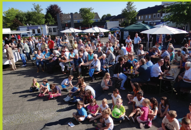
Beim Bürgerfest