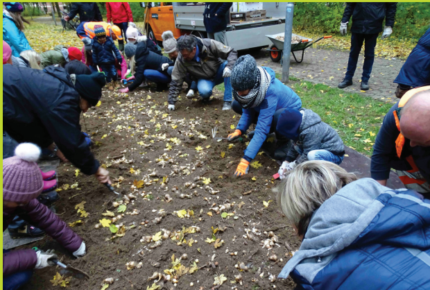
5000 Blumenzwiebeln für das Hagelkreuz