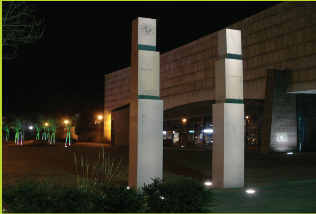
Das Stelentor auf dem Concordienplatz