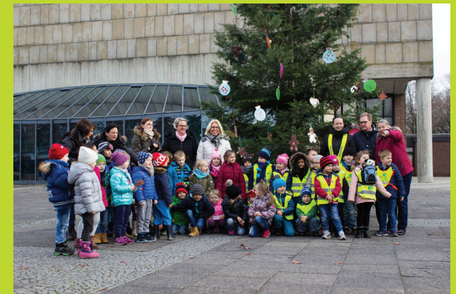
Mit vereinten Kräften – Ein toller Baum!